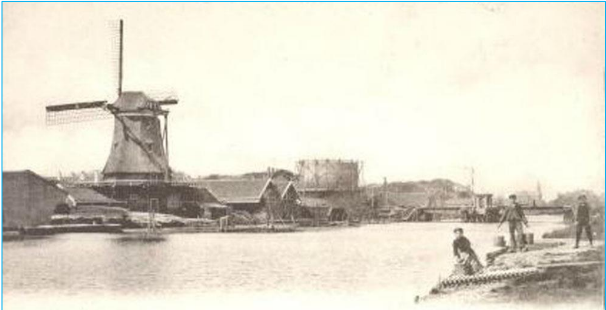
Houtzaagmolen 'De Burcht' van de familie Brantjes aan de Where, ca. 1910. Daarnaast de gasfabriek en rechts daarvan de oude spoorbrug over de Where.

De familie Brantjes speelde een belangrijke rol in het industriële verleden van Purmerend. Klaas Brantjes was landbouwer, ondernemer en garde d'honneur van Keizer Napoleon. Hij bekleedde daarnaast nog vele andere functies, waaronder raadslid, wethouder en dijkgraaf. In 1824 kocht Klaas Brantjes houtzaagmolen 'De Burcht' aan de Where (nu Oeverlanden). In datzelfde jaar ging het Groot Noordhollandsch Kanaal open, waardoor Purmerend een verbinding kreeg met de zee. Zo werden de handelsmogelijkheden aanzienlijk vergroot.